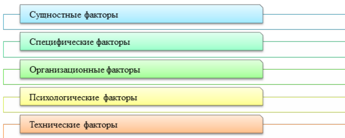
Рис. 1 Факторы (критерии) оценки качества управления финансами сектора государственного управления Составлено автором. Источник: [1]

По мнению Макашиной О.В., «оценка качества управления финансами в государственном секторе должна основываться на системе специальных критериев, которые выступают индикаторами результативности и рациональности финансовой деятельности. Такие критерии не ограничиваются лишь количественными параметрами, а отражают совокупность характеристик управленческих процессов, позволяющих объективно судить о профессионализме и эффективности органов государственной власти и местного самоуправления» [1]. Автор считает, что фактически критерии качества управления финансами можно рассматривать как инструмент комплексной диагностики, с помощью которого оценивается не только результат исполнения бюджетных и налогово-финансовых функций, но и соответствие этой деятельности принципам прозрачности, законности, экономической целесообразности и социальной ориентированности. При этом особое значение приобретает их систематизация: для обеспечения полноты анализа вся совокупность критериев должна быть распределена по отдельным группам, каждая из которых раскрывает определённый аспект финансового управления - институциональный, организационный, экономический или социальный (рис. 1).